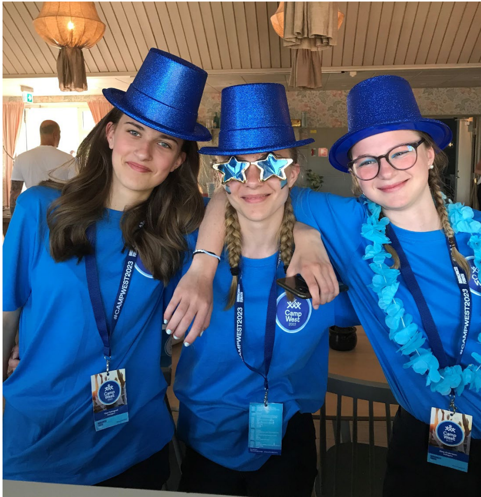
Glada deltagare på ungdomsstorlägret.

Under Kristi Himmelfärdshelgen reste 24 ungdomar, både cancerdrabbade och syskon, och sju ledare till Camp West, Barncancerfondens ungdomsstorläger, där närmare 200 personer samlades för fyra dagar med gemenskap, glädje och livslånga minnen.