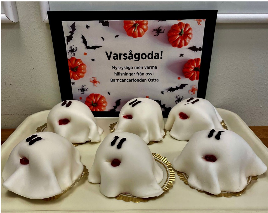
Halloweenbakelser på avdelningen.

För att skapa trivsel på Barncancercentrum i Linköping finansierar föreningen att det varje dag dukas upp en extra god frukost på avdelning BOND. Vid högtider ser föreningen till att det bjuds på något extra gott att äta för dem som tvingats vara kvar på sjukhuset både i Linköping och Kalmar. Barn får även julklappar och födelsedagspresenter.